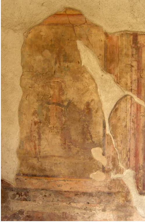
Fig. 2 : Pompéi, Maison des épigrammes (V, 1, 18), exèdre (y) : panneau ouest du mur nord (les trois frères dédiant leurs filets à Pan).